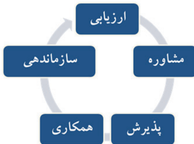
شکل ۱. الگوریتم مدل ۵آ

در اجرایی کردن اهداف آموزش بود. مرحله چهارم همکاری و توسعه برنامه عملی بود. و مرحله پنجم پیگیری بود، انجام شد، گروه مداخله تحت اجرای برنامه خود مدیریتی بر اساس روش ۵ آ در طی ۱۲ هفته از طریق ملاقات حضوری،